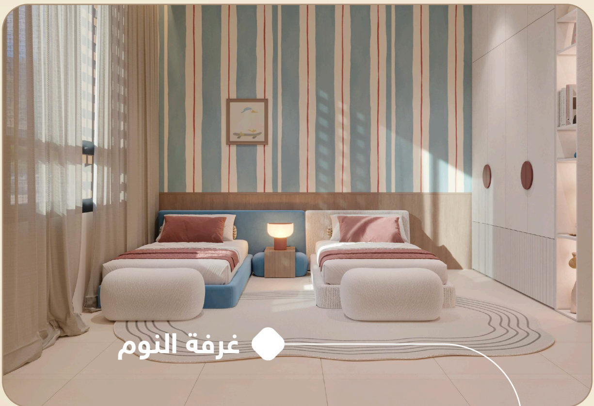
● غرفة النوم