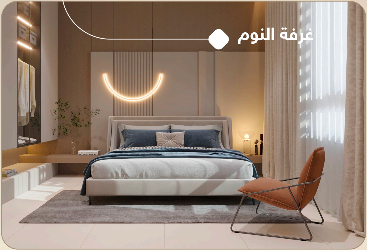
● غرفة النوم